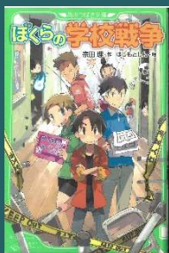
ぼくらの学校戦争 宗田 理 // 著 J/913/ウ

市内の中学校 5 校から生徒が職場体験にきてくれました。本に関心のある中学生が選んだおすすめしたい本を紹介文と一緒に展示します。ここに掲載しきれなかった本もティーンズコーナーに展示しているので、みにきてね！