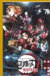
劇場版鬼滅の刃 無限列車編 ノバライズ 吾峠 呼世晴 // 原著 913.6/コトウ

モスクワ近郊の農村に暮らす少女のセラフィマは、村一番の狩りの名手でした。しかし、セラフィマの日常は突如として奪われてしまいます。突然村へやって来たドイツ軍によって母親や村の人達を惨殺されたのです。セラフィマの生き方から、戦争の恐ろしさがよく分かり、怒り・悲しみ等の感情に入り込んで読むことができます。第十一回アガサ・クリスティー賞受賞作！戦争や歴史に興味のある人はぜひ読んでみて下さい。