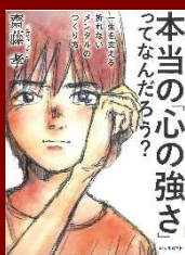
本当の「心の強さ」 ってなんだろう？ 齋藤 孝 // 著 J/159/ウ

これは、インターネットを中心に活動するホラー作家の雨穴さんのデビュー作。深掘ればどんどん不可解な点が浮かびあがってくる家の間取り。そんな間取りを雨穴と栗原が解明する中でたどりつく衝撃の事実がとてもおもしろいです。日常に刺激がほしい人にぜひ読んでほしいです。