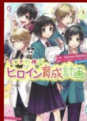
ヒロイン育成計画 HoneyWorks // 原案 913.6/ハコウ

この本のいい所は、一章ずつ主人公が違って、悩んでいることも違うのに、何か共通していてそれを探すのが楽しくていい所だと思います。この本は、何かに悩んでいる人にぜひ読んでほしいです。