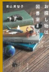
お探し物は 図書室まで 青山 美智子 // 著 913.6/アヤマ

この本とは学校の図書館で出会いました。どんな内容かということ、人間の人間くんが両親に売り飛ばされ、悪魔の孫にされて悪魔の学校に通うことになる一というものです。おすすめポイントは、人間くんの人柄と個性豊かな悪魔たちです。ぜひ読んでみてください。