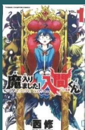
魔入りました！ 入間くん 西 修 // 著 726.1/シ

本当に心が強いとはどういう意味だろう？「自分はメンタルが生まれつき弱い…」「努力してもどうせ変わらない…」それ、本当だと思う？この本のテーマは心の強さ。まずはメンタルの強さの本質からこの本を通じて学んでいこう。