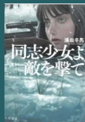
同志少女よ、 敵を撃て 逢坂 冬馬 // 著 913.6/アコウ

モブ女である高校一年の涼海ひよりは、生きるためにLIP×LIPのマネージャー見習いとして働くことになります。だがLIP×LIPの愛蔵と勇次郎はひよりのことを嫌っているみたいで…。そんなある日、ライブ会場で助けてくれた相手に一目惚れし、なぜかLIP×LIPと協力して「シンデレラ」になることに？！ヒロインの奮闘と勇気に元気をもらえます！元気をもらいたい人におすすめです！