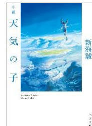
天気の子 新海誠（著）

この本には1話2ページのエピソードが100話収録されており、哀しい結末、楽しい結末、考えさせられる結末がそれぞれの話の2ページ目に隠されています。2ページでガラッと展開が変わるので、どんどん読み進めたくなり、癖になります！読みやすいので、ぜひ手に取ってみてください！