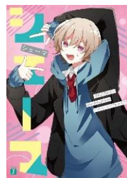
シエーマ Chinozo （原作・監修） 三月みどり（著）

ハリー・ポッターのもとに届いた一通の手紙。そこから始まる魔法界での生活。ハリーは2人の友人と様々な体験をしていく。ハリーに待ち受ける運命とは…。 読み始めたら止まらない名作ファンタジー。現実では体験できない非日常へ。さあ、ハリーに会いに行こう。